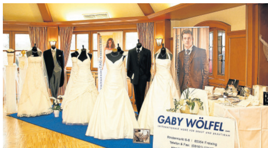
Mädchenträume werden wahr: Eine feine Auswahl an Brautkleidern - von klassisch elegant bis pfiffig modern - gibt es auf der Hochzeitsmesse Erding.

F ußball auf der Hochzeitsmesse: Während die Bräute Hochzeitskleider begutachten, können die zukünftigen Ehemänner bei der Bundesliga-Konferenz am Samstag via Sky im Hotel-Restaurant Hallnberg mitfeiern und sich auf das Spitzenspiel FC Bayern München gegen Borussia Dortmund (Beginn 18.30 Uhr) einstellen. Auf Kosten des Hauses gibt es für jeden Gast ein 0,3 Liter Weißbier. DO